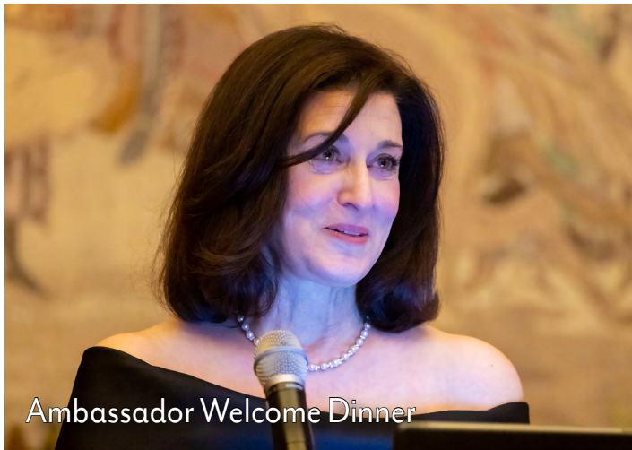
Ambassador Welcome Dinner