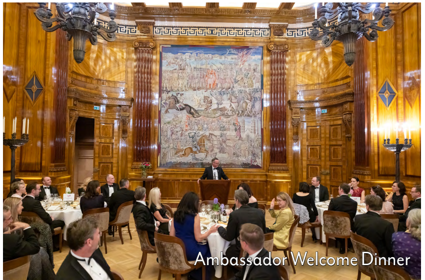
Ambassador Welcome Dinner