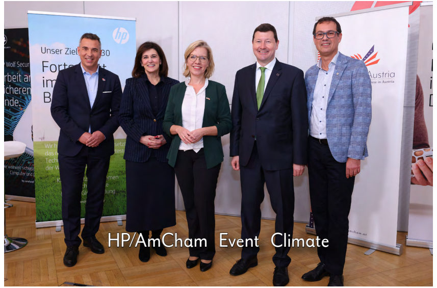
HP/AmCham Event Climate