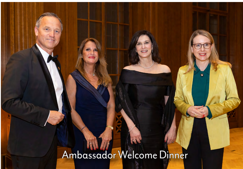
Ambassador Welcome Dinner