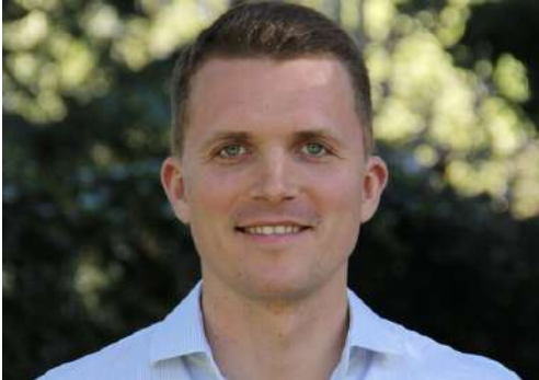
Markus Gstöttner, Stv. Kabinettschef des Bundeskanzlers