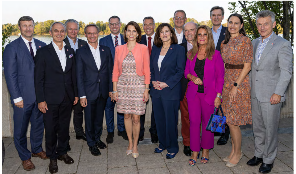
160 Gäste feierten Sommerausklang mit Amerikanischer Handelskammer in Österreich