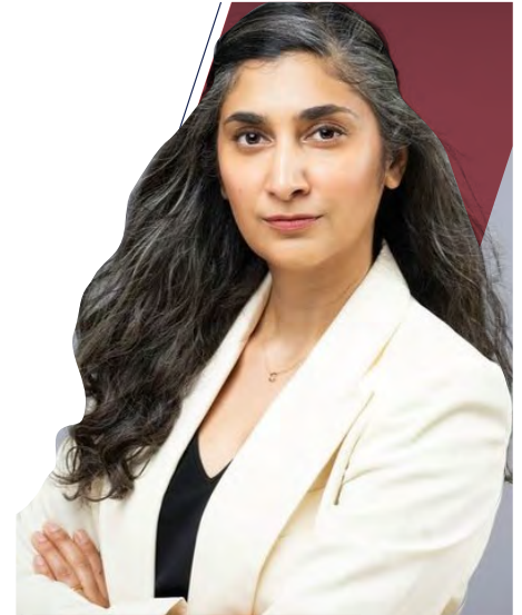
Inu Manak © Council on Foreign Relations

However, for our trusted trading partners and allies, such as Austria, there remain opportunities to strengthen our economic bonds and pursue pragmatic solutions to our shared problems. Firms, in particular, have an important role to play for three key reasons. First, they can support resilient supply chains by assessing their own vulnerabilities and shoring up the supply of critical goods through stockpiling in some cases, and coordinating with allies to ensure the free flow of strategic goods in others. Second, where Austrian firms have a comparative advantage that is mutually beneficial to U.S.-Austrian economic interests, firms should leverage their strengths to deepen those ties. For example, 67% of all Austrian exports to the United States are high-tech exports, including environmental technologies. With the United States representing the third largest target market for Austria’s environmental technologies, there are opportunities to expand upon the vast investments already made in the United States that would in turn support new high quality jobs in this sector. Third, firms can pivot additional investments to partners in the Americas to help support a robust regional supply network of trusted traders and investors. In the last few years firms have learned to “re-globalize” with a more strategic focus on supply chain links, and these actions will generate more stability and predictability over time.